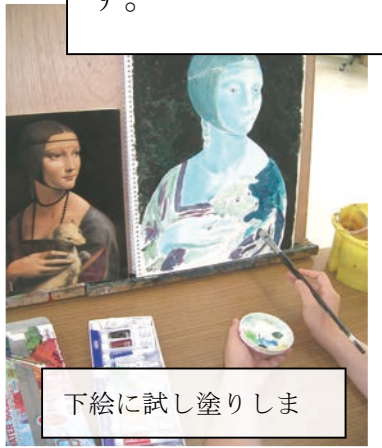
下絵に試し塗りしま

・描いた動物から1つを選び、「白テンを抱く女」に抱かせるように合成させ、スケッチします。