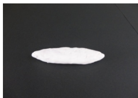
① 芯に粘土をつける