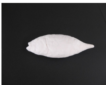
② かたちのもとをつくる