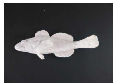
④ 細いタイプのさかな