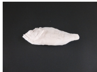
③ さかなのからだをつくる